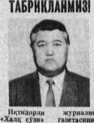
Иқтидорли журналист, «Халқ сузи» газетасининг

Қозоғистон Республикасининг Президенти Н. А. НАЗАРБЕКОВ, Қирғизистон Республикасининг Президенти А. А. АКАЕВ, Россия Федерациясининг Президенти Б. Н. ЕЛЬЦИН, Ўзбекистон Республикасининг Президенти И. А. ҚАРИМОВ.