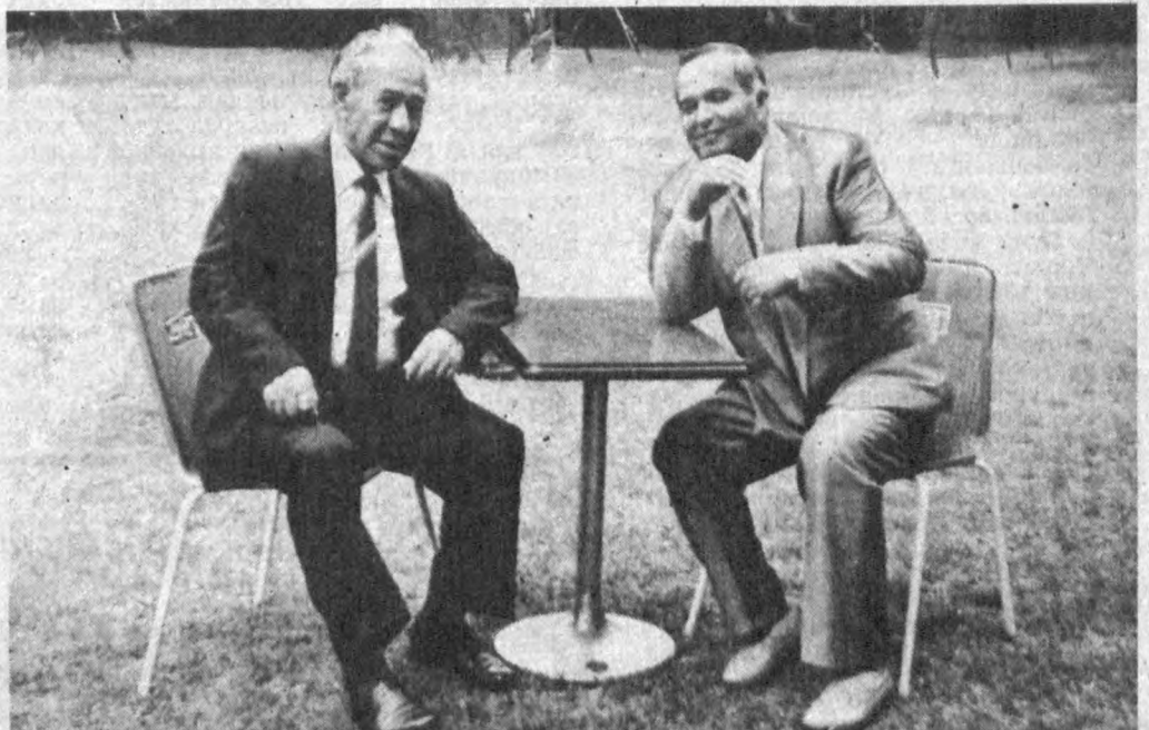
СУРАТДА: Ўзбекистон Республикаси Президенти Ислам Каримов ва халқ шоири Шукрулло. Жанубий Кўриб, Император саройи. 1992 йил, 20 июль.

нинг кун битмаган экан — Сталин турмаларидан ҳам тўрт мучаси бутун чиқиб келди. Истиқлол — оининг ўн беш. Аввалги ўн бешни бошдан кечирган одам учун кейинги ўн беш — истиқлол янада қадрли. Зотан, шоирнинг каломида ҳам аён бўлиб турибди.