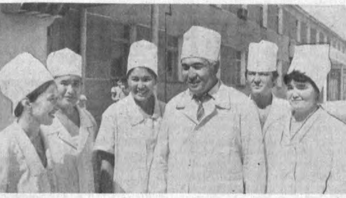
Бўзатов районидagi яқинда қуриб битказилган шифохона район меҳнаткашлари ҳаётида катта воқеа бўлди. Район марказида жойлашган, 150 хонали шифохона ва ҳар кун 200 беморни қабул қилувчи поликлиника биноси жумҳуриятда энг замонавий ва катта муолажа даргоҳларидан ҳисобланади.