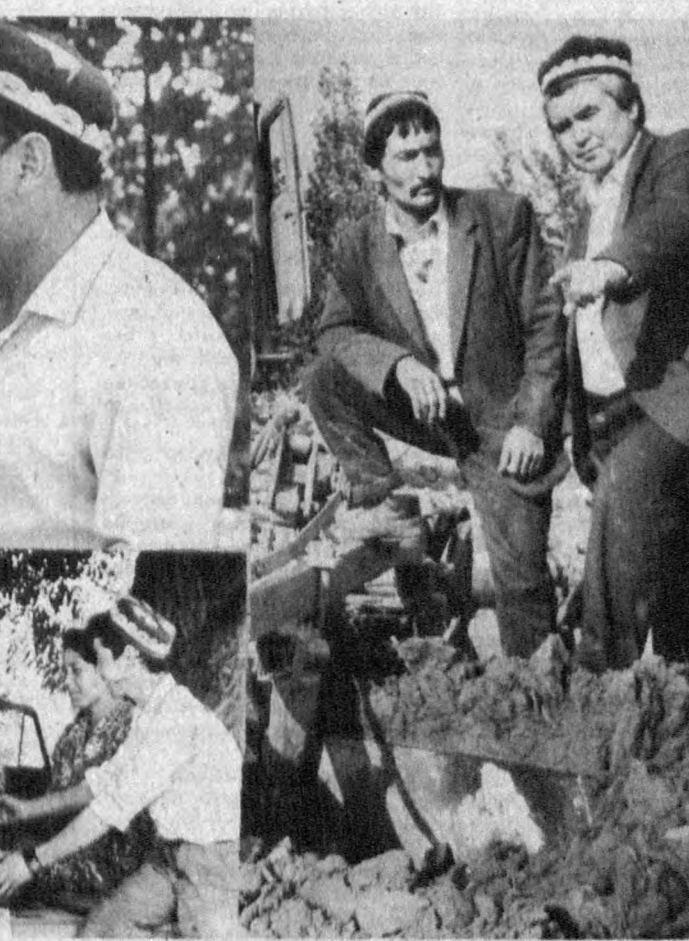
ТУЙ-ТУЙГА УЛАНДИ — ЗАДАРЕ РАЙОНИНИНГ 40 ЙИЛЛИК ТАВАЛЛУД ТАНТАНАСИ ОНА ЎЗБЕКИСТОНИМИЗНИНГ МУСТАҚИЛ-ЛИК ШОДИЕНАСИГА ҚУШИЛИБ КЕТДИ.

Муҳтарам задареликлар! Сизларнинг қўтулуғ туғин-гиз муқаддас Ватанимизнинг бир йиллик тантанасига эш бўлди, қоришиб кетди. Ҳар бирингизда руҳий тетиклик, байрамона қаҳқаҳа. Худди шундай бўлиши, тўй-тўйдай ўтиши керак-да, ахир! Сиз ҳақингизда ўйлаганимизда шонингиз «Бизлар ишлаймиз, бу меҳнат ҳол-лос», деган мисралари ёдига келади. Негаки, Сиз илк бор чўлга от солгансиз. Кўм барханлари уюлиб ётган, сароб жимирлаб турган, шўр туз тупроқ юзини тўсиб қўйган заминга ҳужум қилдингиз. Бу жойни авлодлар