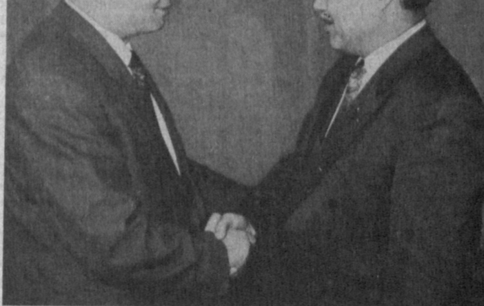
НА СНИМКЕ: во время встреч с хокимом М. Уркумбаевым.