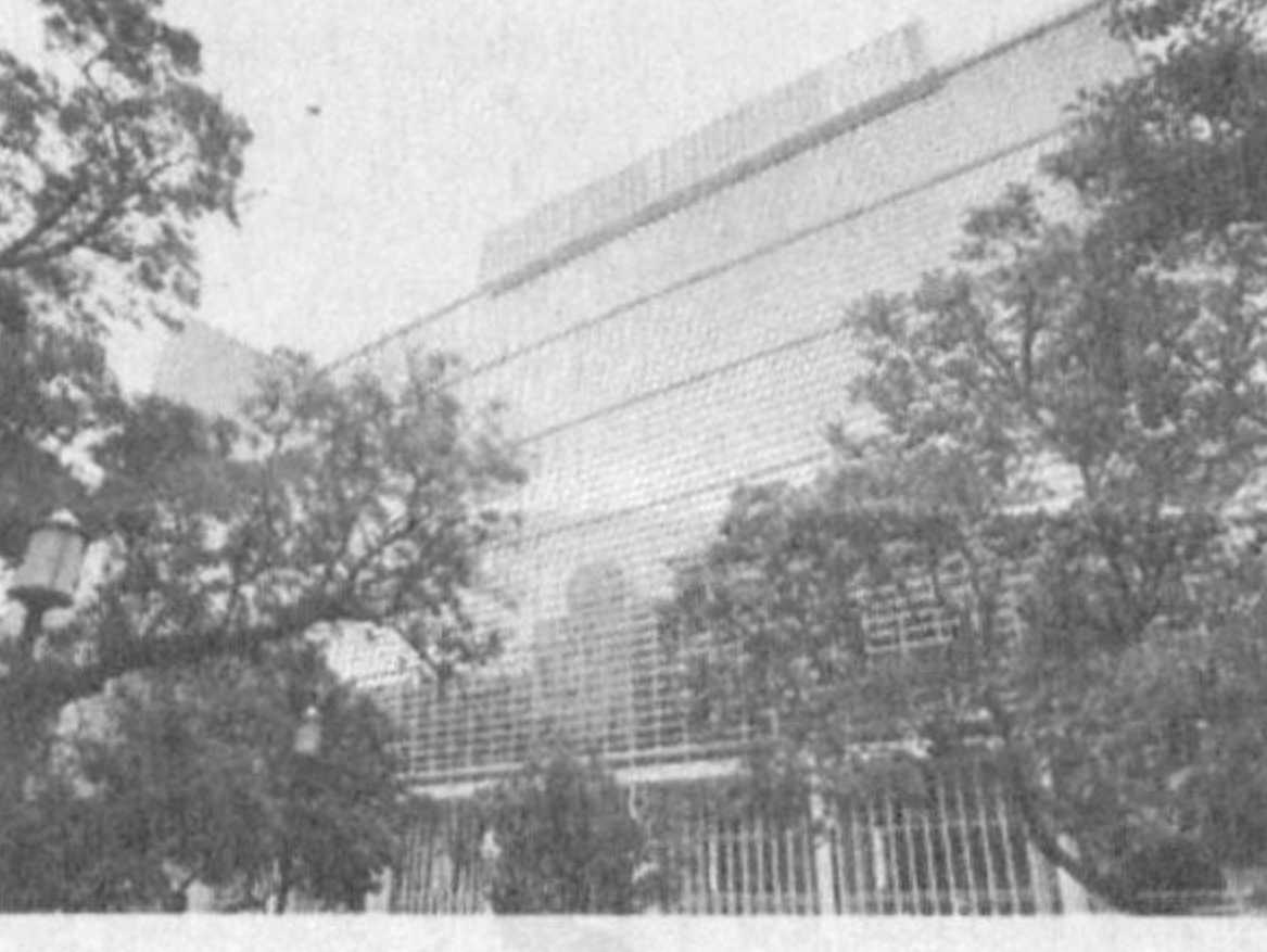
экономическим кризисом. Грузия и Армения, как многие государства, оказались затронуты экономическим кризисом и обратились за помощью к международным финансовым институтам и другим странам.

Всемирный банк одобрил выделение Грузии кредита на сумму 85 миллионов долларов. Предполагается, что указанные средства будут направлены на поддержку реализации курса реформ в стране, а также помогут правительству страны осуществить ряд антикризисных мер.