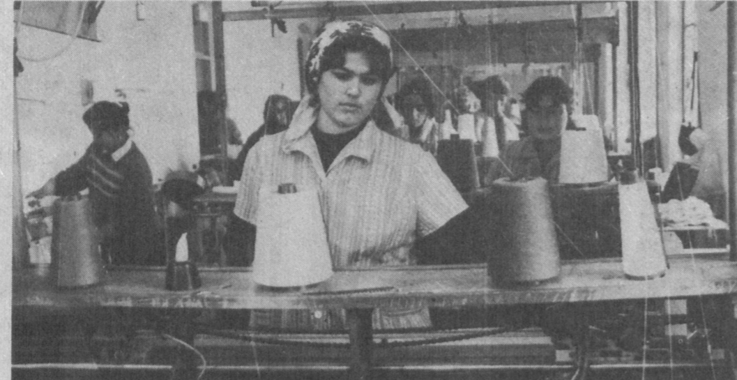
КАШКАДАРЬСКАЯ ОБЛАСТЬ. «Лола» — так называют нарядные районные предприятия по изготовлению и ремонту трикотажных изделий при государственном кооперативном центре бытового обслуживания населения. В прошлом небольшой цех представлял сейчас самостоятельное подразделение с филиалами. Число работающих увеличилось более чем в два с половиной раза.

Новый статус позволил расширить ассортимент, выйти на поставщиков сырья за пределы республики, заключить выгодные сделки, в том числе с зарубежными партнерами. Там, в минувшем году, являлся участником