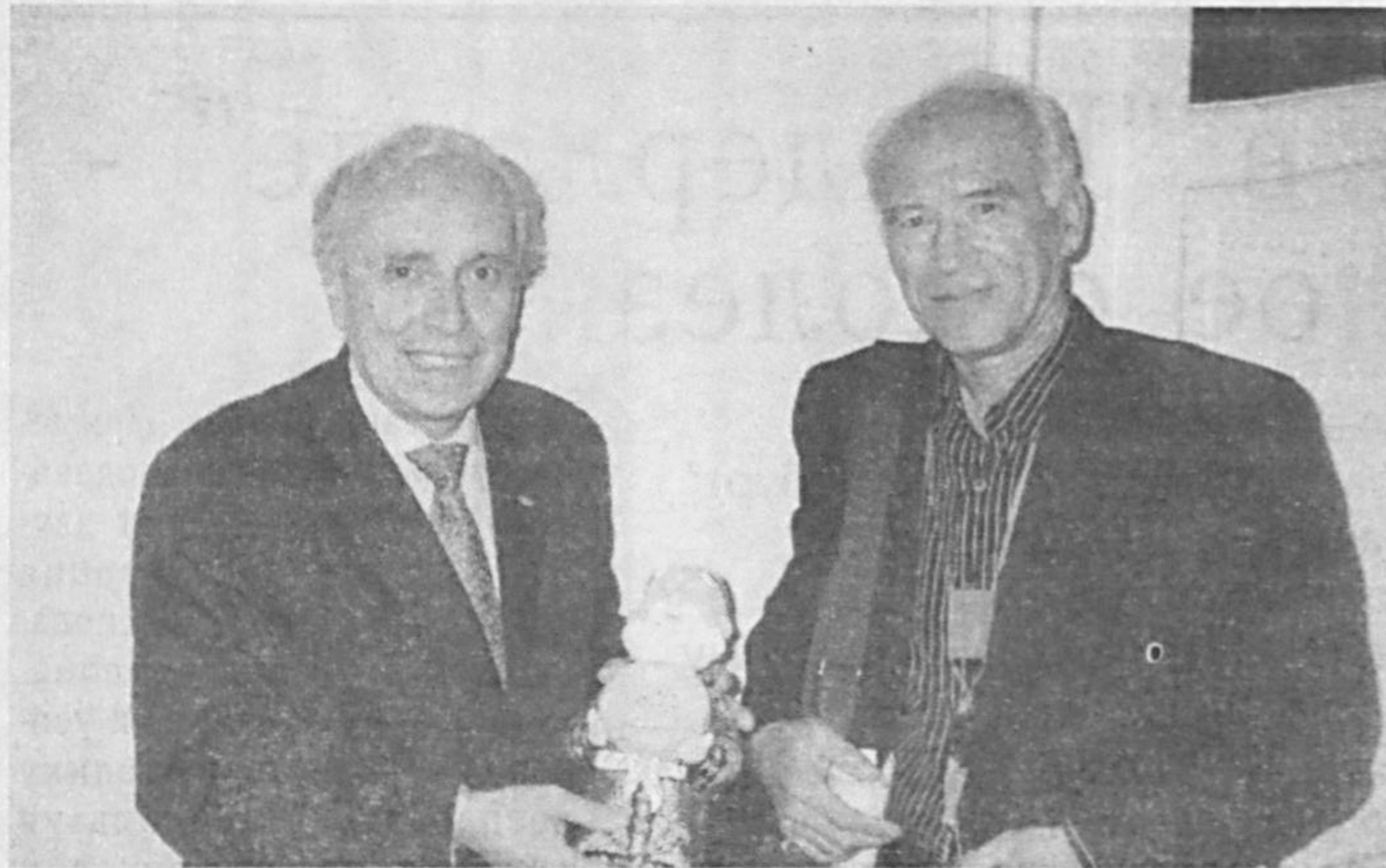
Глава Международной федерации спортивного кино Франко Аскани (слева) и узбекский режиссер-оператор, неоднократный лауреат Миланского финального кинофестиваля Кучкар Каримов.