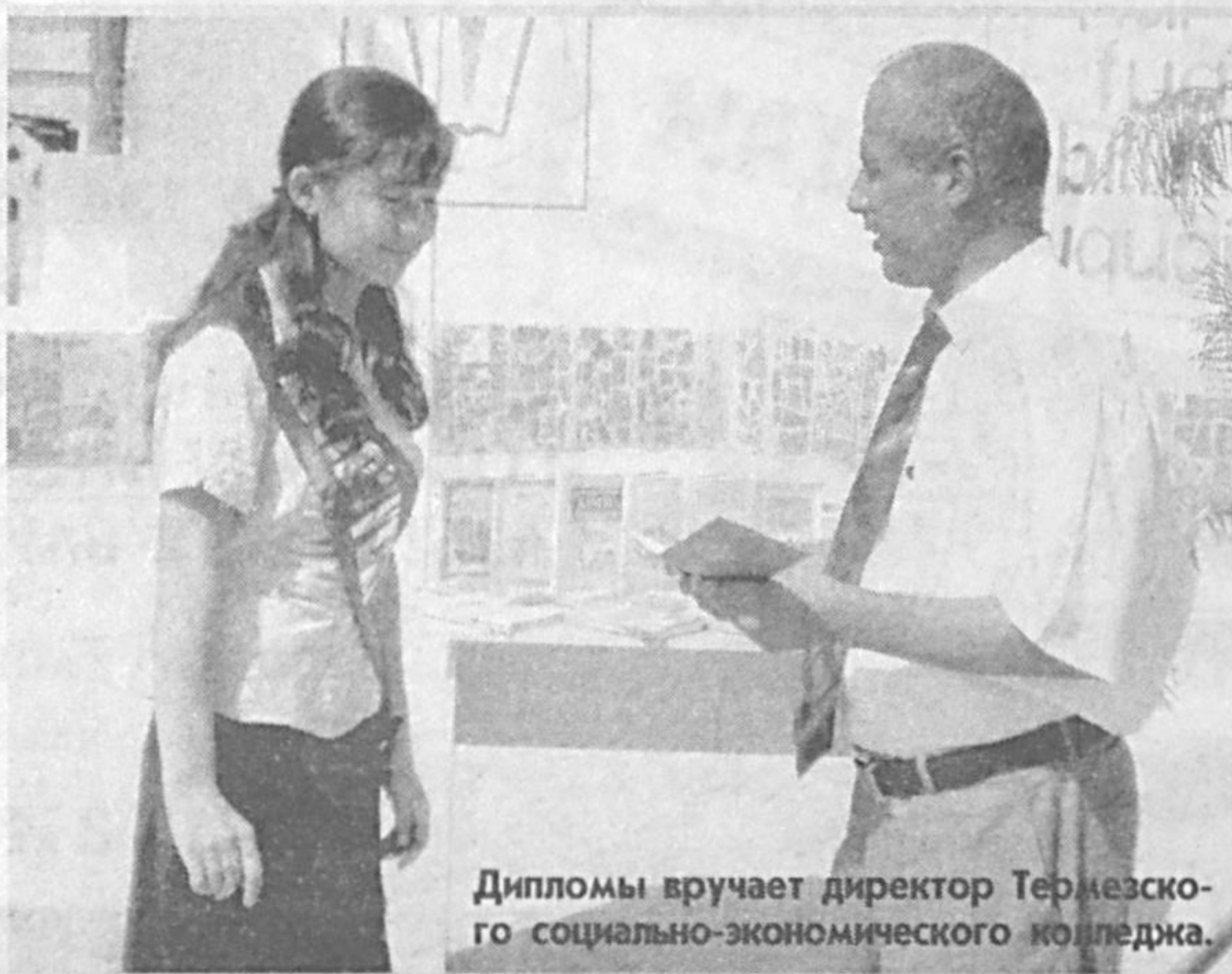
Дипломы вручает директор Термезского социально-экономического колледжа.

Термезский социально-экономический колледж готовит специалистов по семи направлениям: финансы, банковское дело, бухгалтерия и аудит, менеджмент, юриспруденция... В этом году его стены покидают 485 юношей и девушек. 39 выпускников получили дипломы с отличием. На торжественном мероприятии по этому случаю присутствовали работодатели, в том числе и представители самого крупного СП областного центра - "Шиндонг Термез".