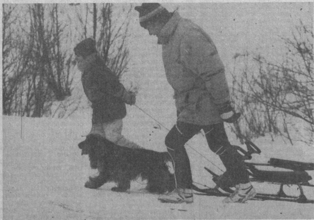
Двое в горах, не считая собак.