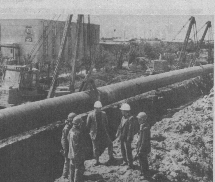
Вид им придется отмечать на финишной прямой. НА СНИМКАХ: сверху — на одном из участков трассы — передовые машины СУ-5 Э. Текст и фото В. БАСКАКОВА.