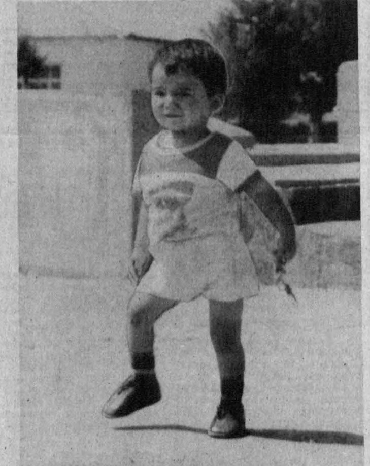
Мустақил одимлар...

ОРИГИНАЛ КОНСТРУКЦИЯДА ИШЛАНГАН, ПАТЕНТЛАНГАН ЧИҚАРГИЧ. Унинг ёрдамида автомобиль гилдирагидан шина бортларини тез ва осон чиқариб олиш мумкин. Автосервис бўлмаган чекка жойларда чиқаргич жуда қўл келади, чунки у содда ва қўлай ишланган. Автомобиль эгалари чиқаргични заводнинг магазин-салонидан устама нарҳларсиз сотиб олишлари мумкин. Ваҳоси 110 сўм атрофида. Манзилмиз: 700057, Тошкент шаҳри, Усто Ширин кўчаси, 117. (26, 43, 50, 82-93-автобусларнинг, 7 ва 10-троллейбусларнинг «Компрессор заводи», «Жомий майдон» бекатлари). Телефонлар: 48-03-61, 48-69-16.