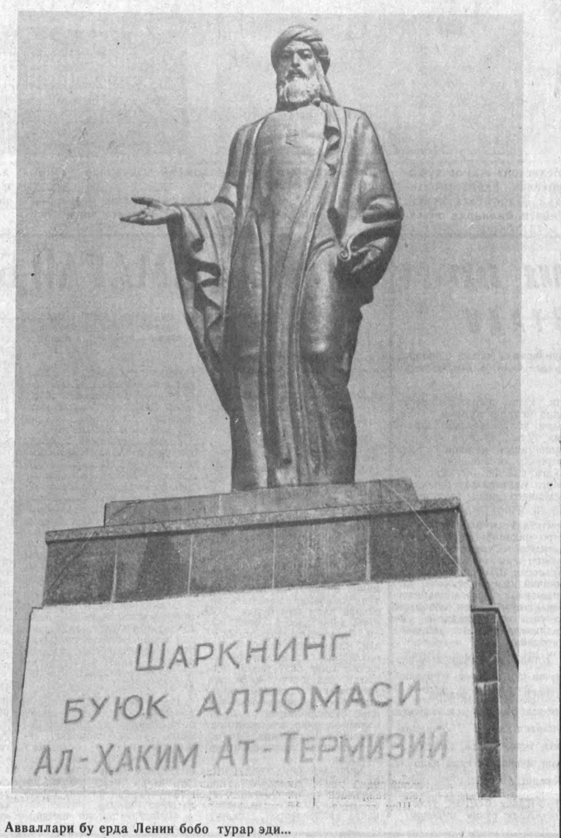
Аваллари бу ерда Ленин бобо турар эди...

Яқинда Америкадаги «Лентон» деган фирманинг уч нафар вакили Бойсунга келди ва денгиз сатҳидан 1246 метр баландликда бўлган кўмир кони кўришди. Гап шундаки, мутахассислар Бойсунда жуда катта миқдордаги захирага эга бўлган кўмир кони борлигини аниқлаганлар. Биладиганларнинг айтишларига қараганда, кўмир захираси 160 миллион тоннадан ошар экан. Америкаликлар эса хомчўтни 1 миллиард тоннага чиқариб юбордилар. «Лентон» фирмасининг ишбилармонлари йилга 500 минг тонна кўмир ишлаб чиқарадиган корхона куришмоқчи. Бу ишга 14 миллион доллар сарфланади. Шахтага темир йўл олиб борилади, алоҳида шаҳарча қурилади. Чунки Бойсун кўмири таркибиде қимматли хом ашё — карбид борлиги аниқланди. Бойсун кўмирининг қиммати 48 доллар деб белгиланди. Барча харажатлар кўмир билан қопланади.