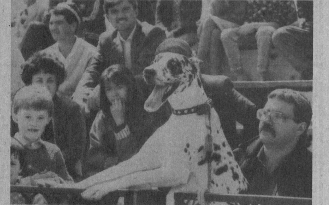
САМАРКАНДСКАЯ ОБЛАСТЬ. Областную выставку собак организовал клуб «Кинолог». На стадионе «Спартак» собрались тысячи зрителей, чтобы увидеть лучших представителей различных пород четвероногих друзей человека. НА СНИМКЕ: удобно устроился.