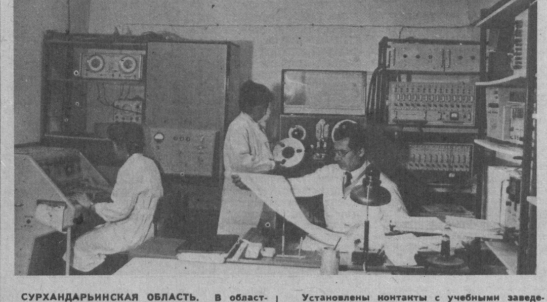
Установлены контакты с учебными заведениями ряда зарубежных стран.