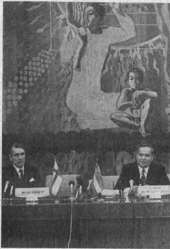
СУРАТДА: матбуот конференциясидан лавҳалар.

Ўзбекистон — Финляндия ҳукуматлари ўртасидаги битимлар имзолашнинг биланоқ 1 октябрь кунин Тошкентдаги Халқлар дўстлиги саройида Ўзбекистон Республикасининг Президенти И. А. Каримов ва Финляндия Республикасининг Президенти М. Койвисто Республика оммавий ахборот воситаларининг вакиллари ва Ўзбекистонда расмий равишда рўй-