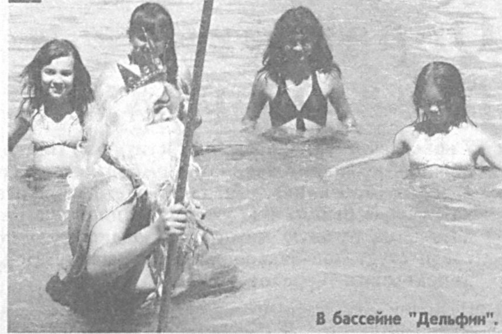
В бассейне "Дельфин".