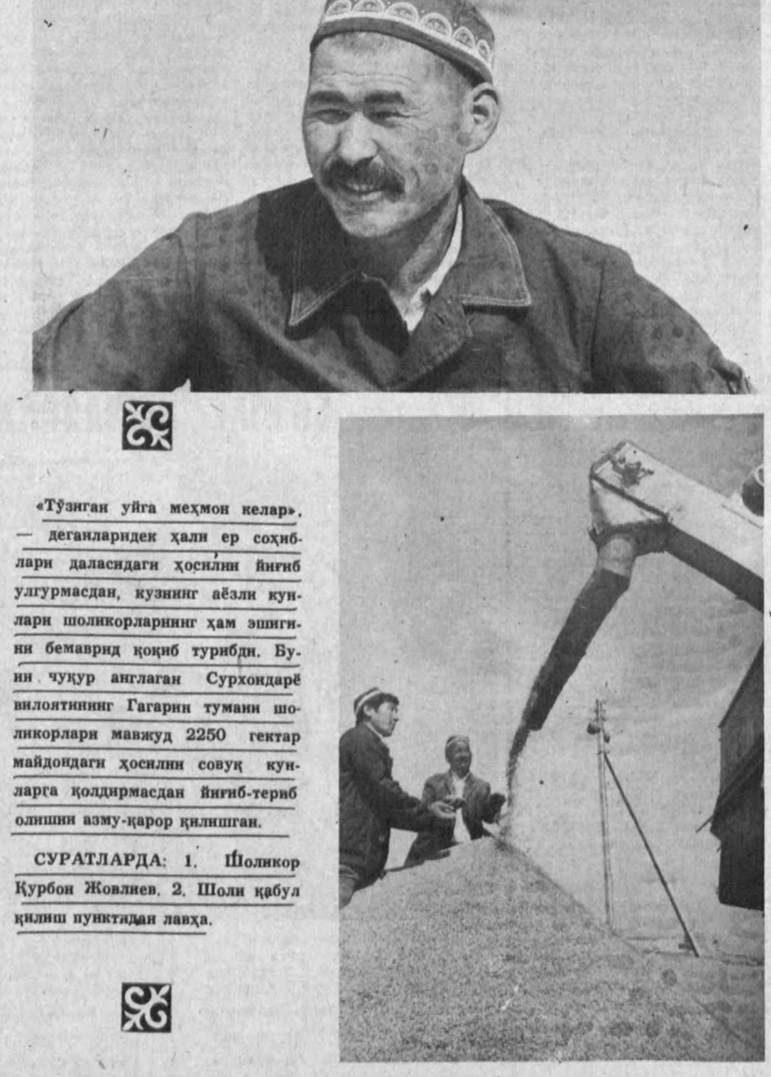
«Тузилган уйга меҳмон келар», — деганларидек ҳали ер соҳиб-лари даласидаги ҳосилни йиғиб улгурмасдан, кузнинг аёзли кун-лари шолкорларнинг ҳам эшиги-ни бемарқаб қоқиб турибди. Бу-ни чуқур аниқлаган Турхондарё вилоятининг Гагарин тумани шо-ликдорлари мавжуд 2250 гектар майдондаги ҳосилни совуқ кун-ларга қолдирмасдан йиғиб-териб олишни азму-қарор қилишган.

Мана бир неча йиллардан бери, Эсин шаҳар республи-ка ҳўқумати шаҳар раҳба-ринининг қоний эътибори-да. Хатто Президентимиз Ислам Каримов ҳам «Эсин