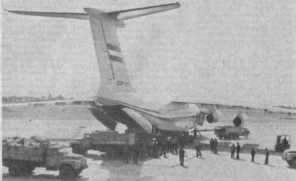
«Дўст кулфатда билинади» — донишманд халқ ана шу келиш учун неча-неча фожиаларни кўрган. Ҳар гал дўст экан, бу олий ҳақиқатни авлодларга йўриқ, сабоқ сифатида кўнларини бошидан кечираётган Тожикистон халқи минг йиллардан буён бир қарра амин бўлди.

ЖУМҲУРИЯТИМИЗ АҲЛИНИНГ ХОҲИШ ВА ИРОДАСИНИ ИНОБАТГА ОЛАР ЭКАН, ЎЗБЕКИСТОН ПРЕЗИДЕНТИ ИСЛОМ КАРИМОВ ЖАҲОННИ ТОҶИК ХАЛҚИГА ЁРДАМ ЗАРУРЛИГИДАН БИРИНЧИЛАР ҚАТОРИ ОГОҲ ЭТДИ.