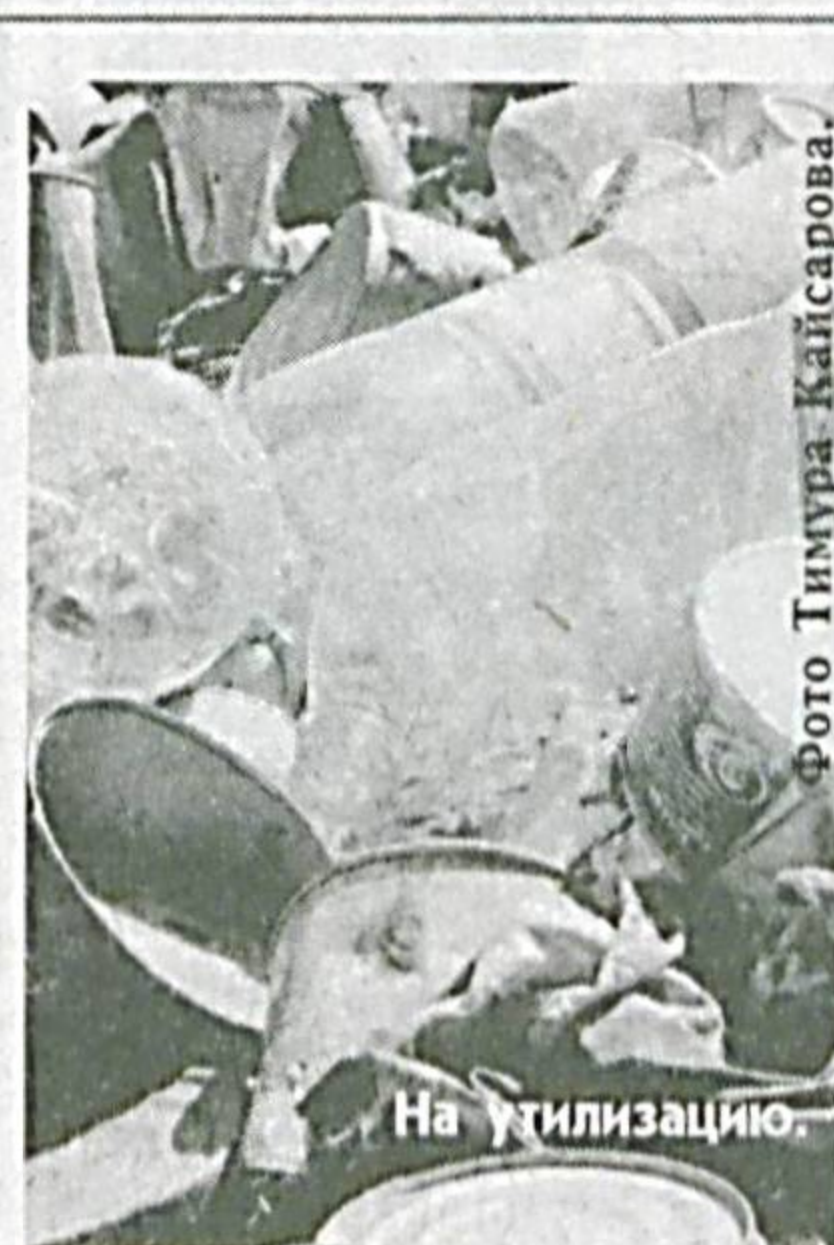
На утилизацию.

В области 10 мусоросвалок. Только из Джизака ежегодно вывозится более 7900 тонн бытовых отходов. Полигоны и свалки, на которые отвозятся промышленные и бытовые отходы, занимают огромные территории, многие из них не соответствуют экологическим и санитарным требованиям. Загряз-