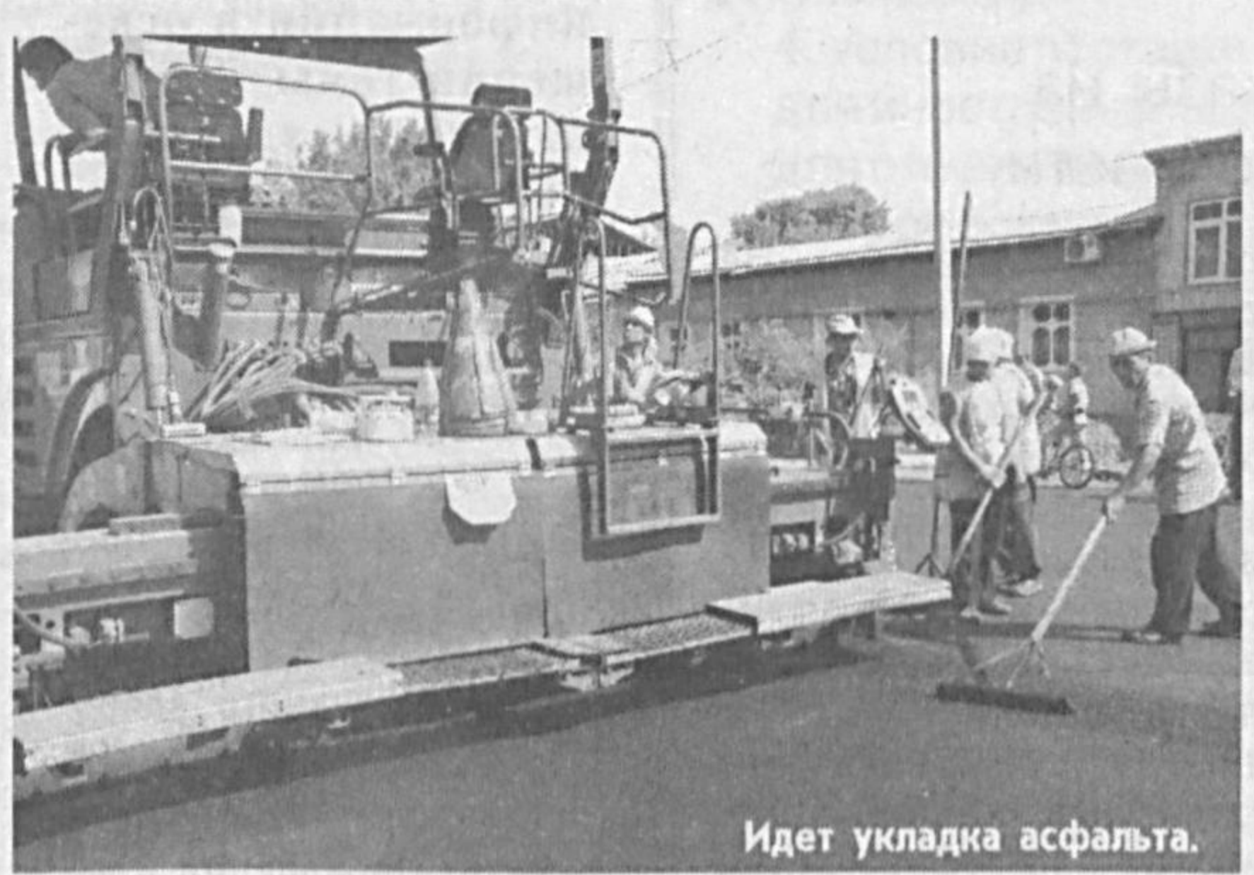
Идет укладка асфальта.

Отделом по ремонту дорог районного управления благоустройства осуществлен капитальный и текущий ремонт дорог в махаллах Новза, Навбахор, Хайрибад и Чарх Камолон. До праздника будут отремонтированы внутренние дороги и тротуары махал-