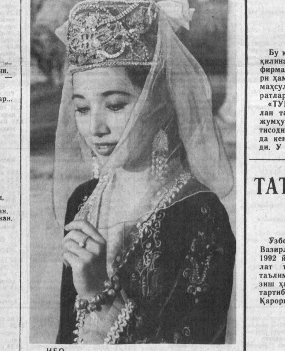
ИБО. М. НАЗАР олган сурат.

— Коккилни кўрсат, ай, сулу. — Ботир ишгит, йўлингдан қолма, Коккилни кўрмоқ истасанг, Қора отнинг ёлға қара. — Кўзларингиз кўрсаткил, сулу. — Боғда чарос кўрганмисан ҳеч? Кўзларим шу чаросга монанд. — Дилим тўла ялғизо, ўтинч, Қошларингиз кўрсаткил, сулу. — Кўрмагансан зулукини, нахот? Икки дошим — икки зулу-ку!