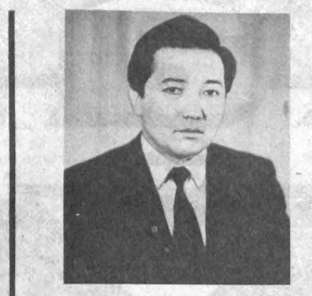
— Савдо ҳодимлари ҳўқидо сўз очилса, неғадир кўчликнинг пениосиси тиришади. Масалан, сиз йилнинг давомида улагайсан савдода ишлаган деб орау қилганимиз? — Еки тақдир тақозоси билан шу соҳага кирганимиз?

Йилнинг давомида ички ишлар бўлими бошлиғи М. Турғунов, 7-хўнар-техника билан