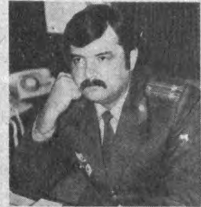
Ўтган йили бу кўрсаткич 28 фоиз эди. Рақамларда айтсак, бу йил жами 177 жиноят рўй берди.