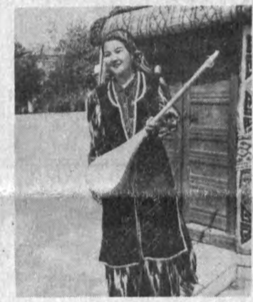
Нукуснинг 60 йиллигига бағишланган мақолалар билан 3-бетда танишсанг.