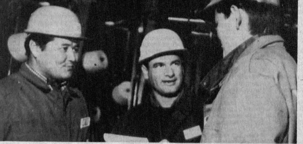
Нукус шаҳрининг шундай ёғинида тўқмақчиллик комплекси қурилиши юксак суратлар билан бормоқда. Қурилиш мутахассислари — «Катекс» (Қорақалпоғистон Республикаси) акционерлик жамияти ҳамда Туркиянинг «Иазекс» корпорацияси ҳисоб-китобларига кўра бу корхона

Сув тошқинлари шаҳарга қаттиқ зиён етказди. Нукус