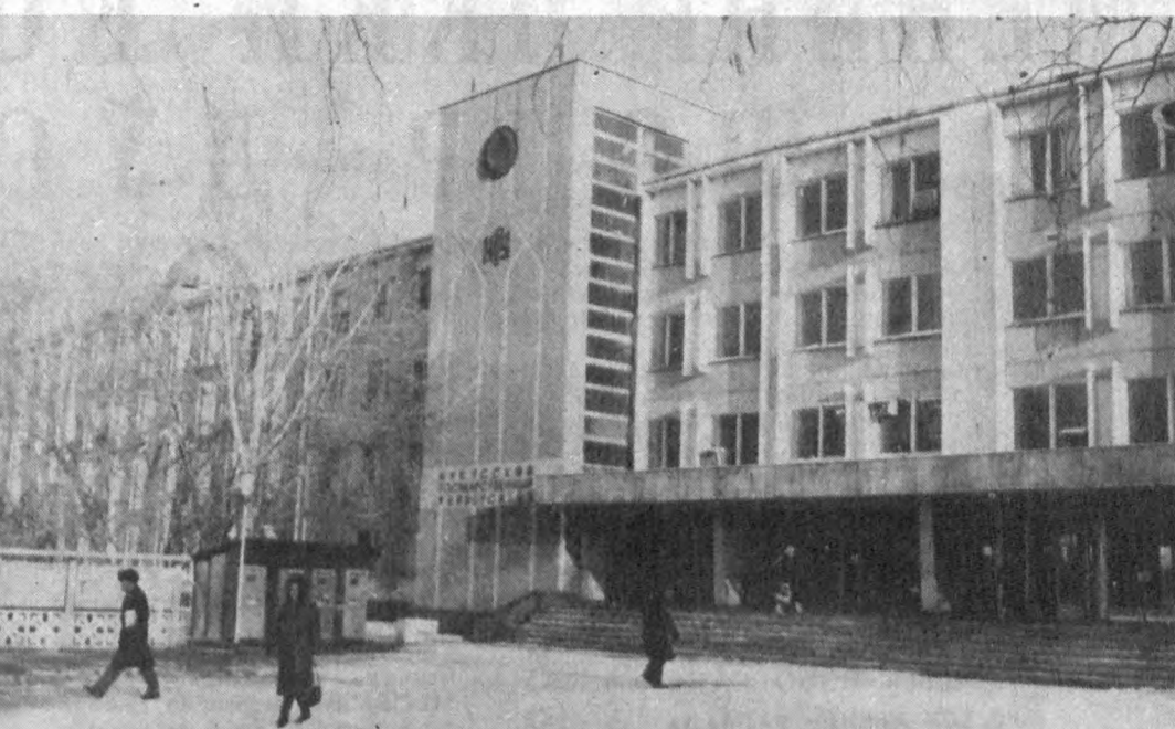
70-йилларда Қорақалпоғистон олий таълим раҳбарини олдидан мавжуд педагогика институтини ўқув базасини такомиллаштириш вазифаси турар эди. Қадрларга бўлган талабининг ўсиб бораётганлиги инобатга олиниб Нукусда давлат дорилфунуни очилди. Ҳозир ана шу кадрлар ўқоғида халқ ҳўжайлини учун мутахассислар бўлиб етиштирилган миңлаб йилит ва қизлар таҳсил кўрмоқдалар.

Пойтахт юбилейига бағишланган байрам тантаналари Нукус отчонарида бошланади. Бир соатли концерт дастуридан сўнг катта театрлаштирилган томошалар ўтади. Унда Амударё атакларида азалдан макон курган халқнинг бутун тарихи асос қилиб олинган. Табиий саҳналарда унинг «Акс» йил «Поскан ел» («Хонавайрон-бўлган халқ») достони билан машҳур бўлган Яқин Жирау, иккиқабдан аввалги Қорақалпоғистон давлат тузумининг вужудга келишида ҳал қилувчи рол ўйнаган Маманбий каби халқ қаҳрамонлари, шунингдек Ерназар Олақўз, Ажнинёз, Бердах сингари таниқли жамоат ва адабиёт арбобларининг сиймолари намойиш бўлади. Нукуснинг раъзий сиймоси кўринишидаги Аёл — она уша тарихий образларини умумлаштириб яқин ясади.