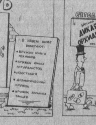
Рис. А. МАРКЕЛОВА.