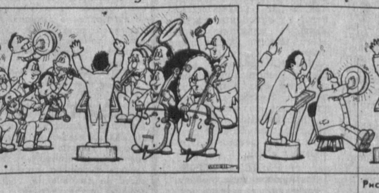
Рис. А. МАРКЕЛОВА.