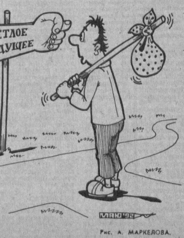
Рис. А. МАРКЕЛОВА.

По меньшей мере 55 человек получили ранения в результате разгона полиции в Дакке шестеи сторонников экс-премьера Бангладеш Эршад. Сотни манифестантов, по поступившим сюда сообщениям, потребовали освобождения их кулира из столичной центральной тюрьмы, где тот отбывает 13-летнее заключение за принажность и коррупцию, злоупотребление властью и незаконное хранение оружия. Манифестанты громили лавки и магазины, забрасывали автомобильными бомбами автобусы и автомобили.