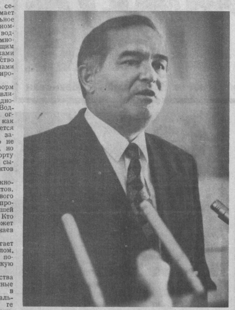
Ислам Каримов, президент Республики Узбекистан.