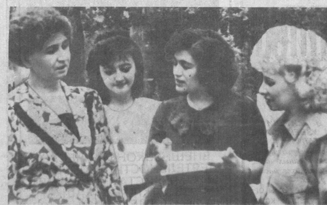
Глянешь со стороны — мир детства покажется таким маленьким, домашним, несерьезным. Но сколько нужно сил положить, чтобы наполнить его теплом, светом, счастьем! Да и существуют ли задачи важнее! Хорошо нашим детям — хорошо всем нам, взрослым. Улыбка малыша дарит нам силы, чтобы жить, работать, совершенствовать большой, «взрослый» мир.

США и весь мир заинтересованы в урегулировании этого кризиса. Русские в качестве национального меньшинства живут во всех новых государствах. Но мы можем и должны понять реак-