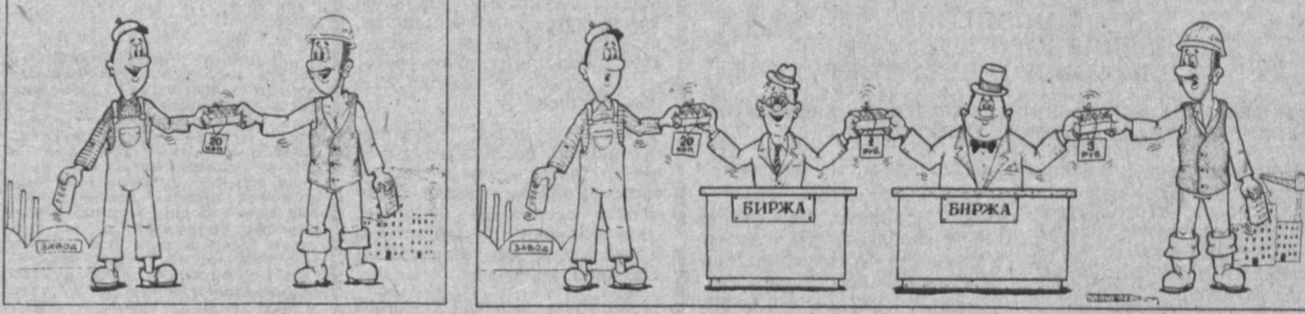
Рис. А. МАРКЕЛОВА.