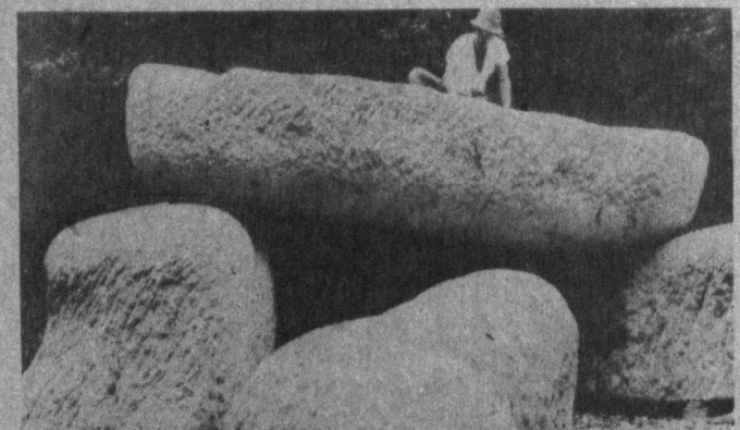
Бу улкан харсанг тошларни табиат нафъ этган, деб ўйламанг. Улар япон ҳайкалтароши Осаму Исикава ижодига мансубдир.