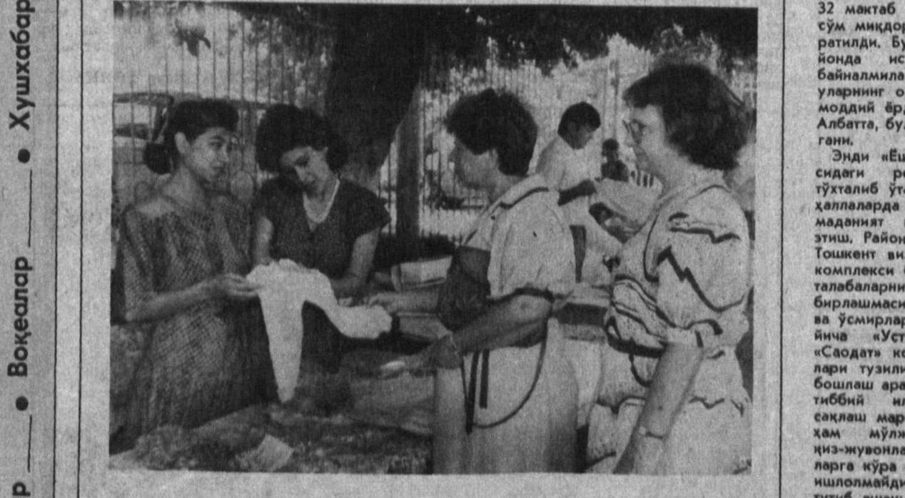
ҲАМЗАГА маълумки, бозор иқтисодиёти шартинда ишбилармонлик билан иш тутишга тўғри келади. Бунинг ўрнида тушунган шаҳримиздаги 15-хунар-техника билим юрти мутасаддилари талабалар томонидан тайёрланган маҳсулотларини савдога сотиш учун қўймоқда. СУРАТДА: билим юрти талабалари тайёрлаган болалар кийимларини сотиш пайти.

МАДАНИЯТ уйимизда турли тўғараклар иш олиб боради. Районда ва маҳаллаларда ўтказилаётган тadbирларда айниқса вокал-чолуе дасталарининг хизмати катта бўлаёттир. Кейинги вақтда фарзандларимизнинг хунари бўлишига эътибор кучаймоқда. Шунинг ҳисобига олиб ҳар кимнинг қи-зиқчишига қараб тўғараклар маҳаллада гул тиниб ўзгаришга бўлса, билим-тиниде 55 киши фаолият кўрсатапти. Бундан ташқари «Шарин» деб номланган миллий ракс деб аталувчи болаларнинг қўшиқ ва ракс дастаси иш ҳам тақсига лойик. Улар иккорта этган қўшиқ, куй ва рақслар қаерда бўлмасин томошабинларини ўзига ром этади. Директоринг ҳамда қария-сурнайчиларимизнинг ҳам маҳоратига тан бериш керак. Бирор янги йўқини, улар иштирок этаган бўлса. Маданият уйимизда 5 та вокал-чолуе дастаси фаолият кўрсатади. Яъни «Ижод», «Наврўз», «Замондош», «Шарқ» ва «Нигор» дасталаридир. Булар ичиде энг кенжаси «Нигор» дастаси бўлиб, унинг иш бошланганга ҳали кўп вақт бўлгани йўқ. Дастанинг ташкил этилиши ҳам жуда қизиб бўлган. Еш хонада Нигора Раҳимқўловнинг Ойинса АМИНОВА, «Замондош» маданият уйининг директори.