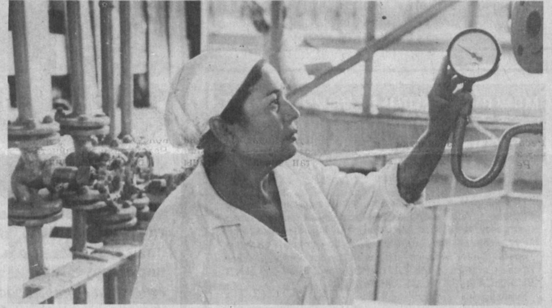
ТАШКЕНТСКАЯ ОБЛАСТЬ. До пятидесяти видов консервированных продуктов выпускают на Янгичинском консервном заводе. За первое полугодие здесь изготовлено 16 миллионов 273 тысячи условных банок — показатели значи-