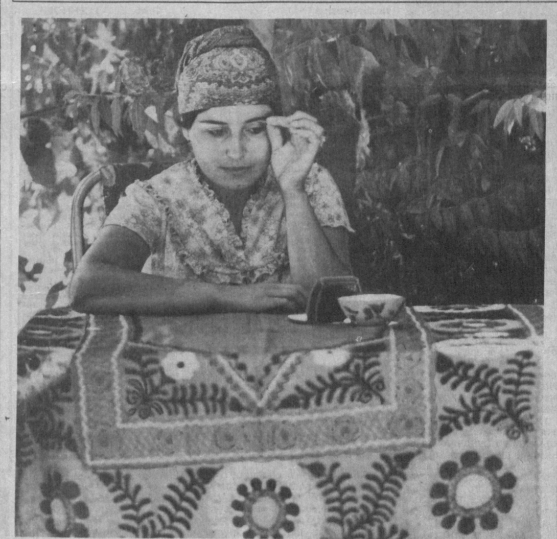
Черные брови, карие очи.

ТЕПЕРЬ МАМЫ ЛЕЧАТСЯ Центр матери и ребенка открыт на базе второй клиники Самаркандского медицинского института. Здесь оказываются специализированную помощь женщинам, перенесшим