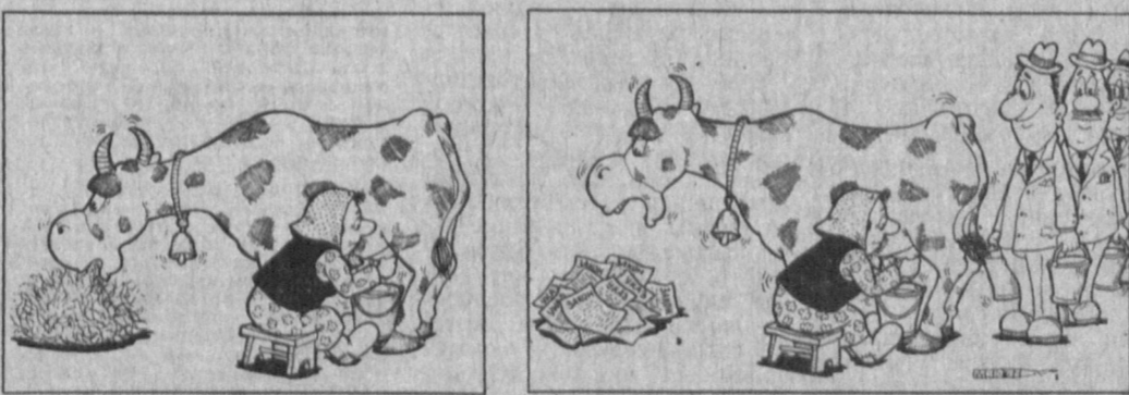
Рис. А. МАРКЕЛОВА.