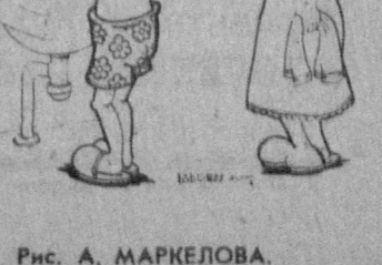
Рис. А. МАРКЕЛОВА.

7.00 «Кайлары тий» 8.00 «Алду». 8.30 «В мире спорта». 9.00 «Музей звуков». 5-я передача. 9.30 «Энциклопедия». В Кустаново. 1-е отделение. 10.50 Мультфильм. 11.05 «Энциклопедия». 2-я передача. 12.30 Намречу Курултай навазов мира. 13.10 «От Алтая до Атырау». Авторалли. 13.05 «Слово о Габите». 2-я передача. 19.05 «Алтын сана». 20.15 «Лесни памяти». Композитор Шибирова. 21.15 «Музистан арга».