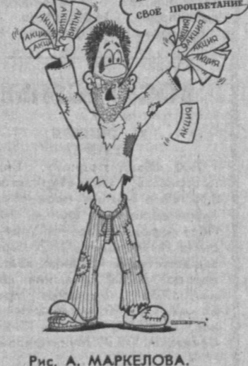
Рис. А. МАРКЕЛОВА.

Купи меня дешево, вы обеспечите свое процветание.