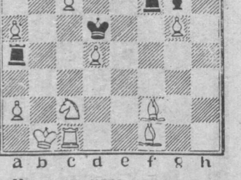
Мат в два хода.