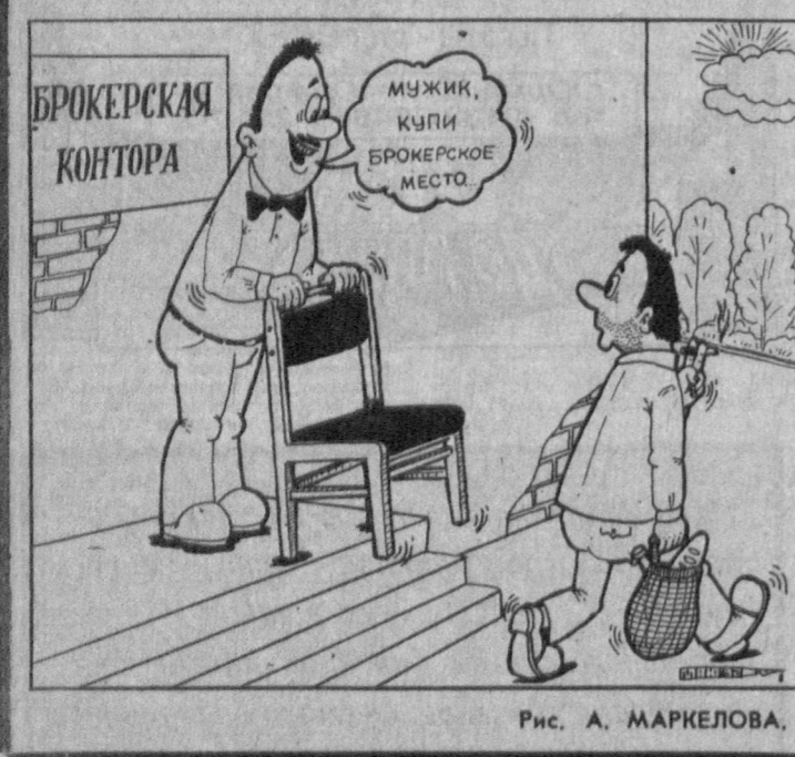
Рис. А. МАРКЕЛОВА.

в комментариях карикатуриста. БРОКЕРСКОЕ МЕСТО