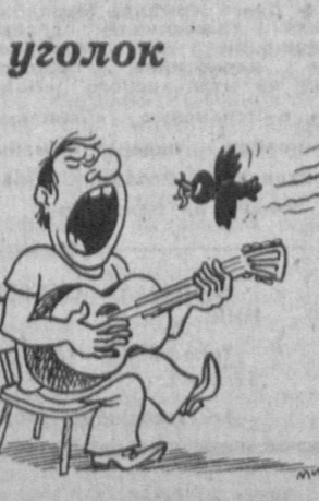
Рис. В. МИЛЕЙКО.

«Уорлднет», 22.10 «Ашук Гадириб», Художественный фильм, УТВ II ПОКАЗЫВАЕТ СТУДИЯ «ТАШКЕНТ» 18.30 «Ассалому алайкум», 19.30 Для детей, «Сюрприз», 20.00 «Ляхза», Информационный выпуск, 20.10 Пресс-центр МВД Республики Узбекистан сообщает..., 20.25 «Хозяин на заметку», 20.40 «В добрый путь!» 21.10 «Ташгордак: сегодня и завтра», 21.55 «Ляхза», 22.05 «Как