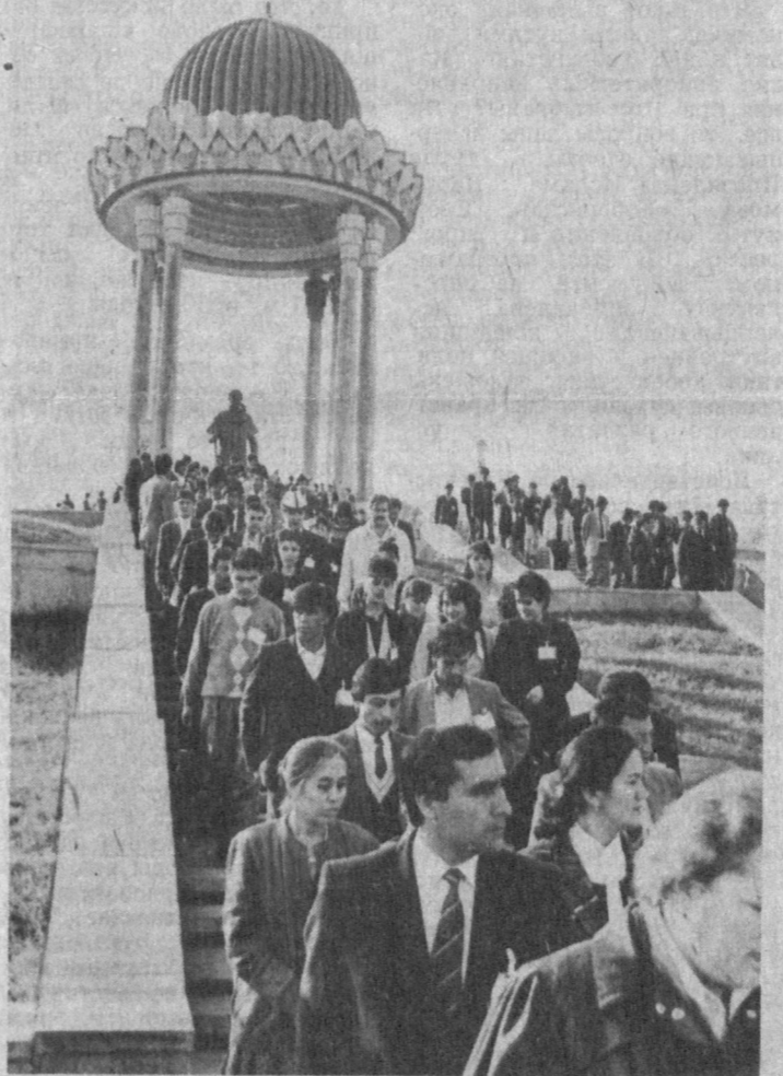
Участники фестиваля возложили цветы к памятнику А. Навои.

Множество ярких осенних букетов украсили 3 ноября подножие памятника Алишере Навои в Ташкенте. С возложения цветов к монументу великому узбекскому поэту началась программа первого Международного фестиваля молодых соотечественников. В Ташкент приехали более 250 предпринимателей, представителей молодежных организаций, работников промышленных и сельскохозяйственных предприятий из 21 страны — 13 зарубежных и восьми республик СНГ. Накануне они познакомились с деятельностью крупных заводов столицы Узбекистана, осмотрели ее достопримечательности.