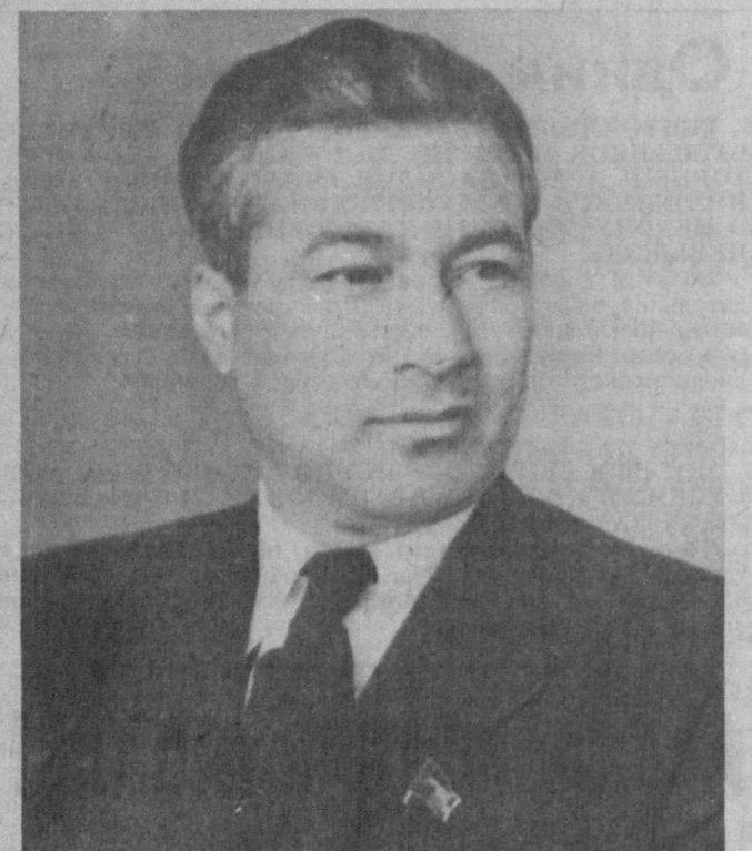
Редактор республиканской газеты «Кизил Узбекистон».