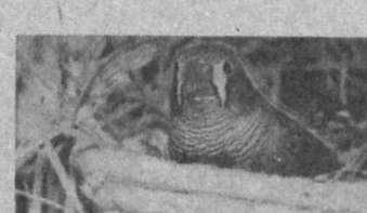
Вот так удобно устроилась самка зебровой амадины в искусно связанном гнездышке.