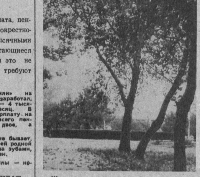
Ждет зиму природа.