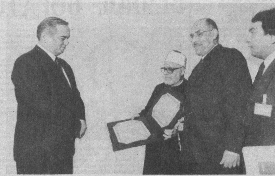
Во время вручения И. А. Каримову диплома доктора наук каирского университета «Аль-Азхар».

Визит Президента Республики Узбекистан Ислама Каримова в Арабскую Республику Египет завершился успешно. Нет сомнения, что этот официальный визит поднимет на новую ступень исторические связи между Египтом и Узбекистаном — странами, которые внесли заметный вклад в развитие мировой науки и культуры.