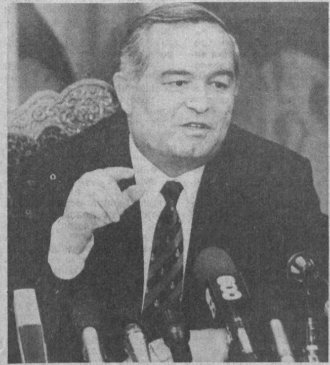
НА СНИМКАХ: во время пресс-конференции.