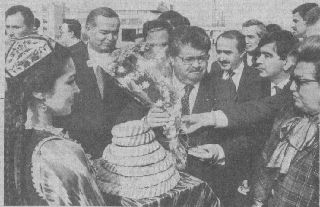
НА СНИМКЕ: встреча в аэропорту.

Продолжается официальный визит в нашу страну правительственной делегации во главе с Президентом Турецкой Республики Тургутум Озалом