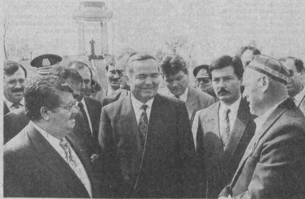
НА СНИМКЕ: знакомство с достопримечательностями Ташкента и его жителями.

В напоенной весенним дыханием атмосфере аэропорта 4 апреля чувствовалась особенная торжественность. Ибо ожидалось прибытие официальной делегации Турции во главе с Президентом Турецкой Республики Тургутум Озалом. Здесь помнят, что братская, единокровная Турция была первой страной, признавшей независимость нашей республики и тем самым открывшей ей путь в мировое сообщество.