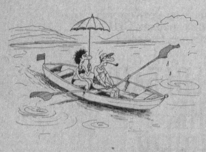
Рис. В. НЕНАШЕВА.

Учредитель: ЖУРНАЛИСТСКИЙ КОЛЛЕКТИВ «ПРАВДЫ ВОСТОКА»