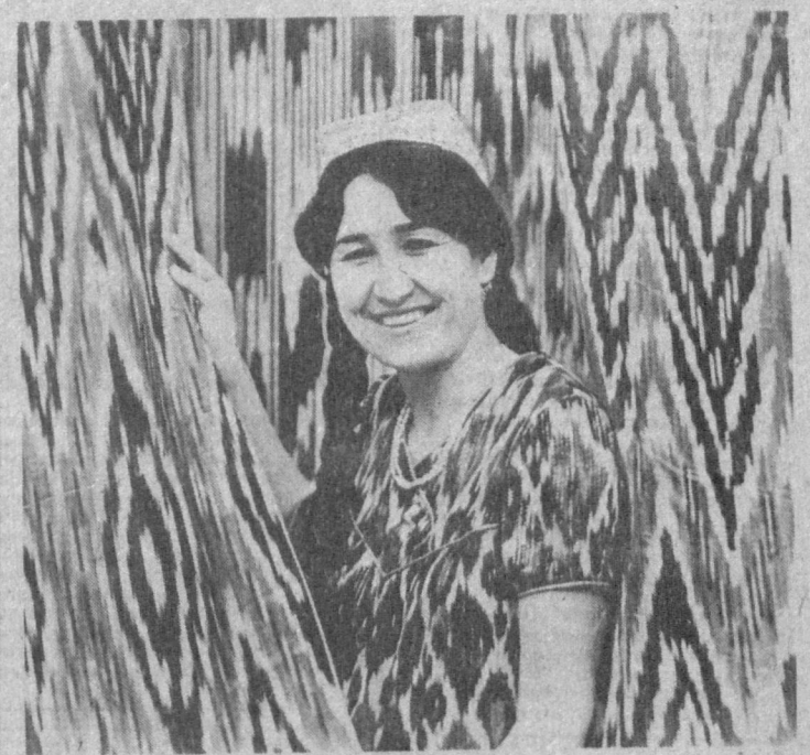
Стабильно трудится коллектив Шахриханской атласной фабрики...