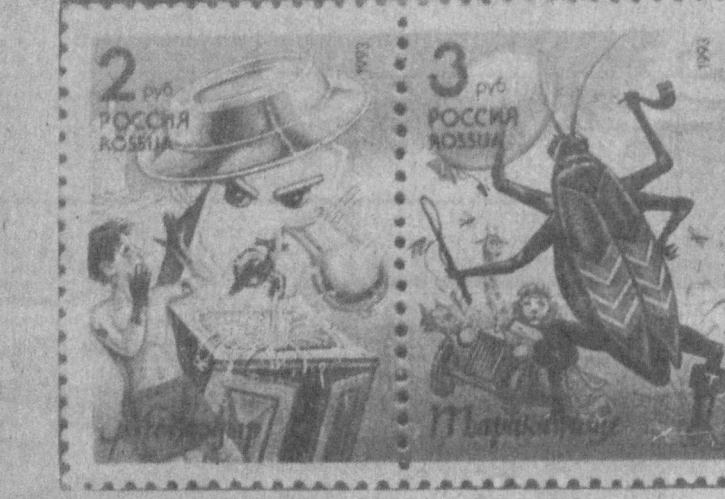
Бармалей за 25 рублей