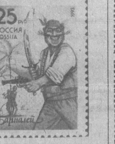
Бармалей за 25 рублей

На презентации моментально была раскуплена большая партия марок новой серии. А для коллекционеров, как обычно, было организовано специальное гашение этой серии. (РИА-ФОТО).