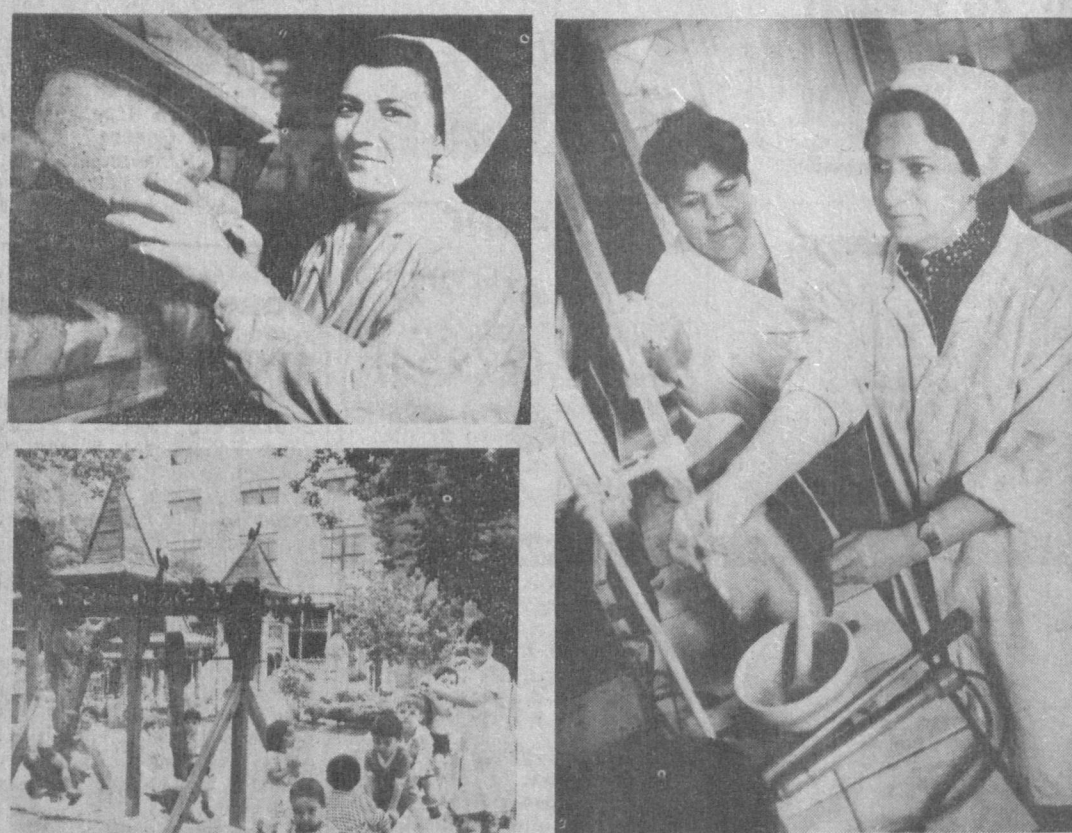
Уже на проходной хлебозавода № 3 объединения «Ташхлеб» чувствуется пьяниющий запах свежеспекаемого хлеба. Печи здесь работают круглосуточно, выдавая его в сутки около 90 тонн разных сортов.

Уже на проходной хлебозавода № 3 объединения «Ташхлеб» чувствуется пьяниющий запах свежеспекаемого хлеба. Печи здесь работают круглосуточно, выдавая его в сутки около 90 тонн разных сортов. Об этом поблизился профессор только здесь. Радуют пекари и детей — каждый день машины отвозят в магазины бакалии, сладкую соломку. Все, что работает здесь, хорошо понимают, что хлеб — всему голова, и на столе у человека он всегда занимает особое место.