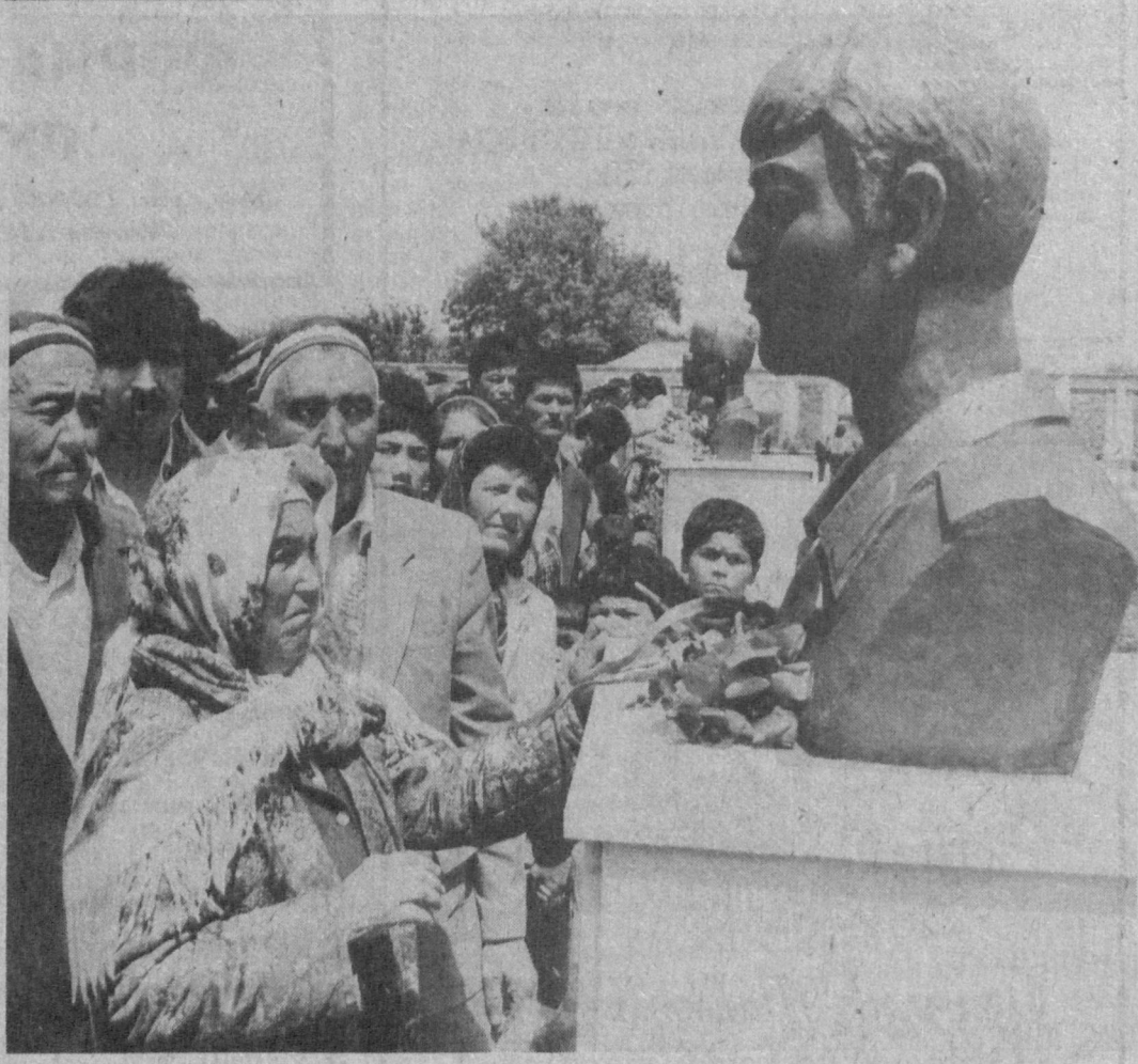
ВСТРЕЧА С СЫНОМ... (В Фаришском районе Дризанской области открыты бюсты воинам-интернационалистам, погибшим в Афганистане).