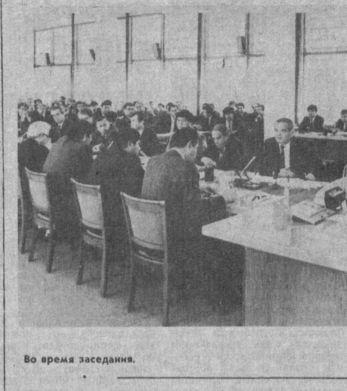
Во время заседания.

Ислам Каримов отметил тот вклад, который вносит господин Гельфи в развитие делового сотрудничества между Узбекистаном и Францией. Рассказывая гостям о своем недавнем визите в Германию, Президент отметил, что немецкие бизнесмены стремятся к сотрудничеству с нашей республикой.