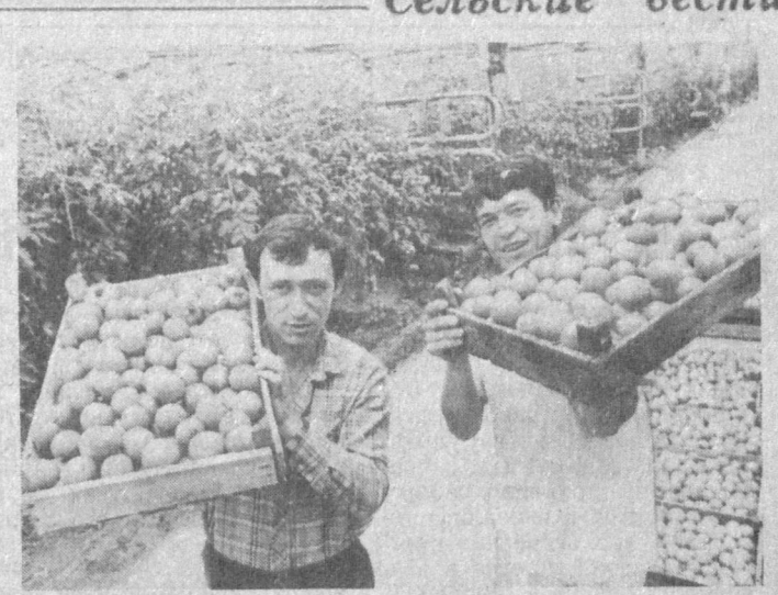
Более 40 тонн огурцов, помидоров и зелени поставили с начала года торговля токами столицы республики труженники тепличного комбината колхоза имени Ю. Азубаева Ташкентского района.

Несмотря на то, что на каждого работника комбината приходится по 10 соток площадей, все в гектарах капитальных тепличных теплиц и еще три гектара пленочных содержатся в образцовом порядке.