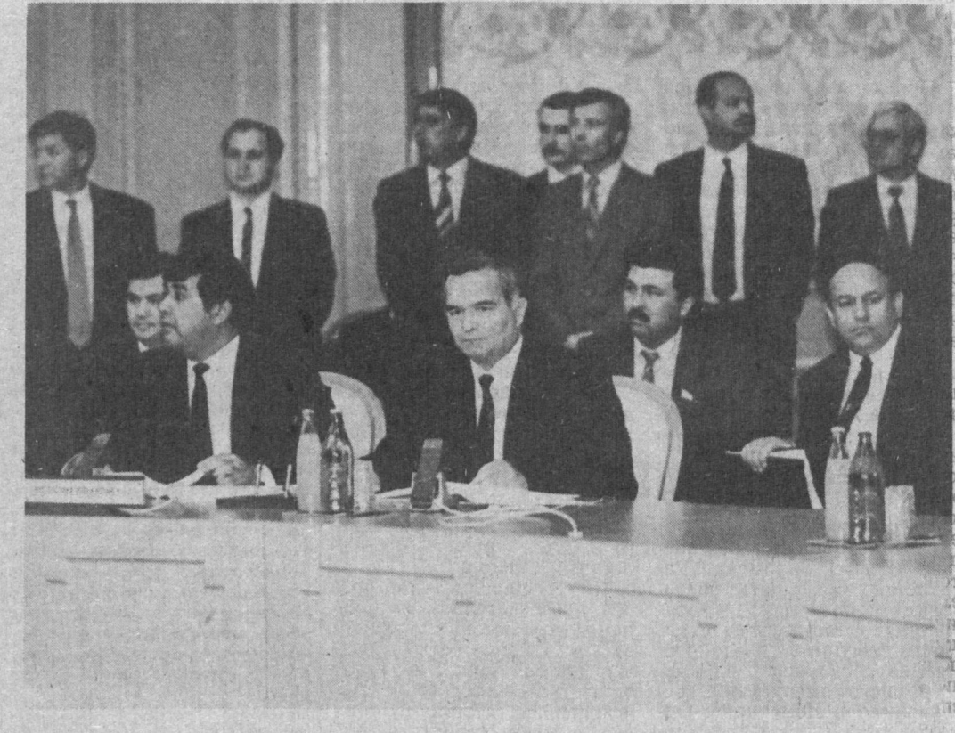
НА СНИМКЕ: во время встречи.