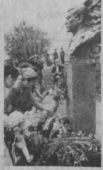
АЛЫЙ МАК — ВЕСНЫ ЗНАМЯНЕ

Много их, этих крупных и ярких цветов, расцвело нынешней весной у небольшого поселка Майский. Отсюда, с зеленого поста, далеко просматривается холмистая, изрезанная канавками долин и тропинками, ажно-красными коврами на зеленом поле.