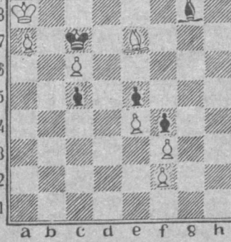
Белые начинают и делают мат в три хода. Ждем ваших писем с ответами.