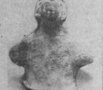
На снимке: одна из фигурок, найденных у траншеи.

С. АШИРОВ. Наштатный инспектор Республиканского общества охраны памятников истории и культуры Узбекистана.