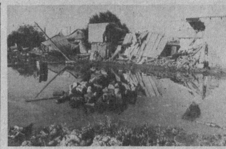
Резкие перемены погоды, наблюдаемые в Средней Азии в этом году, становятся уже традиционными.

На Ташкентском авторемонтном заводе № 1 впервые в истории автомобилестроения республики переоборудованы на газосамосвалы два самосвала «ЗИЛ-ММЗ», принадлежащие концерну «Ташгортранс».