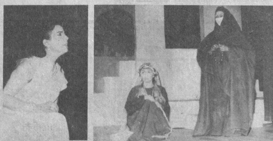
Наши духовные ценности

Причем две команды выходили на нее дважды — «звезд» юмористов Национального гвардии и веселый десант Самаркандского высшего военного автомобильного командно-инженерного училища. Под хохот театрального зала они сражались в финальной встрече. Его девизом стали слова известного киногероя: «Восток — дело тонкое».