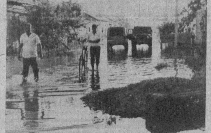
НА СНИМКАХ: затопленные дома в микрорайоне «Янги кишлон».

В ближайшее время в 2,5 раза будут повышены цены на уголь и в 2 раза на газ.