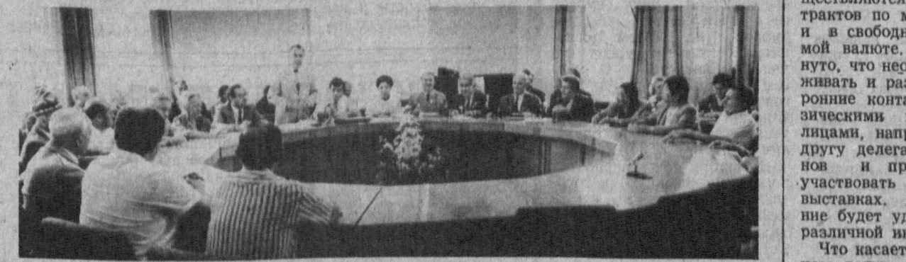
Позавчера в Республиканском совете ветеранских организаций Узбекистана звезды сияли в... полдень! Они украшали грудь людей, чьи имена составляют трудовую доблесть республики.