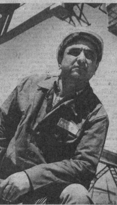
Несмотря на разрыв экономических связей, дороговизну энергоносителей, многие строительные подразделения сумели выстоять, преодолеть спад производства и даже продвинулись вперед.