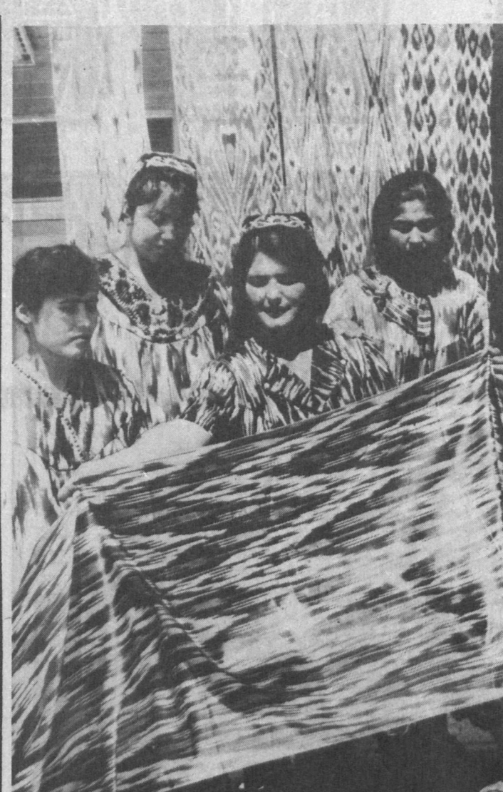
Более тридцати видов всех цветов радуги выпускает продукция Наманганская фабрика шелковых тканей.