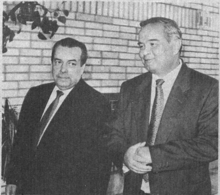
отношений между руководимым им международной организацией и деловым миром Узбекистана.